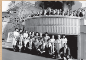
昭和60年6月 鐘釣町 「大阪町中時報鐘」里帰り記念祭