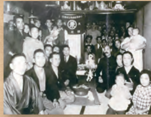
昭和16年4月 石町 運送業を営む家での「護摩焚き」この後、日本は戦争に向かう。これが最後の祈祷だったかも、と。

注1 大阪国際ビルディング 1973年~1977年の間、大阪で一番高いビルだった。今、ハルカスが見えると嬉しい感覚と同じ?(ハルカスが見えて嬉しいのは私だけ?!)