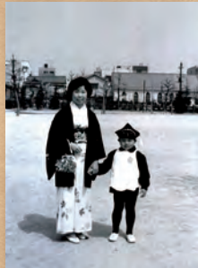
昭和44年4月 中大江公園 中大江幼稚園へ入園。桜の季節の記念撮影は今も見られる。