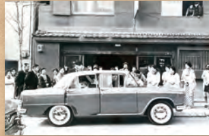
昭和36年1月 内野町 花嫁は自宅で支度して式へ